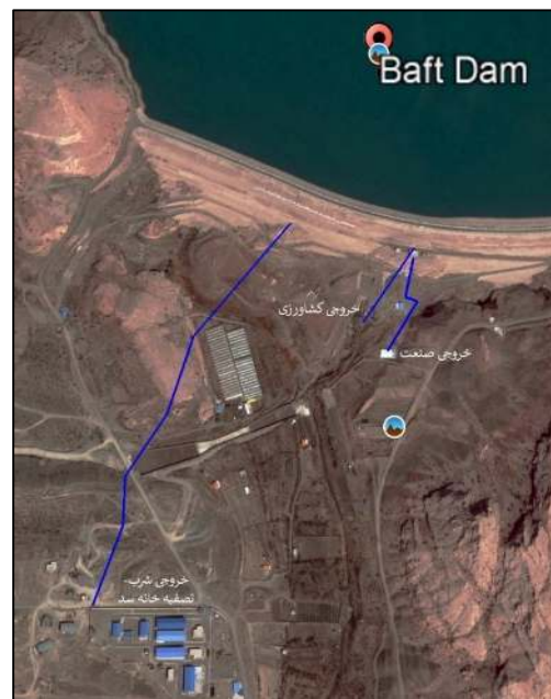
شکل (۳) پلان (تصاویر ماهواره ای) خروجی شرب، صنعت و کشاورزی از سد بافت

طراحی نیروگاه‌های برق آبی کوچک: ایده نیروگاه‌های کوچک در مواردی استفاده می‌شود که جریان آب یا سایر مایعات دیگر مانند خروجی فاضلاب یا جریان آب شور و ارتفاع (هد) مناسبی هم موجود باشد. واحدها ممکن است بسته به شرایط فیزیکی سایت، شفت‌هایی به‌صورت عمودی، افقی و یا مورب داشته باشند. در حالت کلی، تفاوتی بین تجهیزات کنترلی واحدها با شفت افقی و عمودی وجود ندارد. تجهیزات موردنیاز، کاملاً به شرایط کاری پروژه موردنظر بستگی دارند (آی تریپل ای ۱ ، ۱۹۸۸).