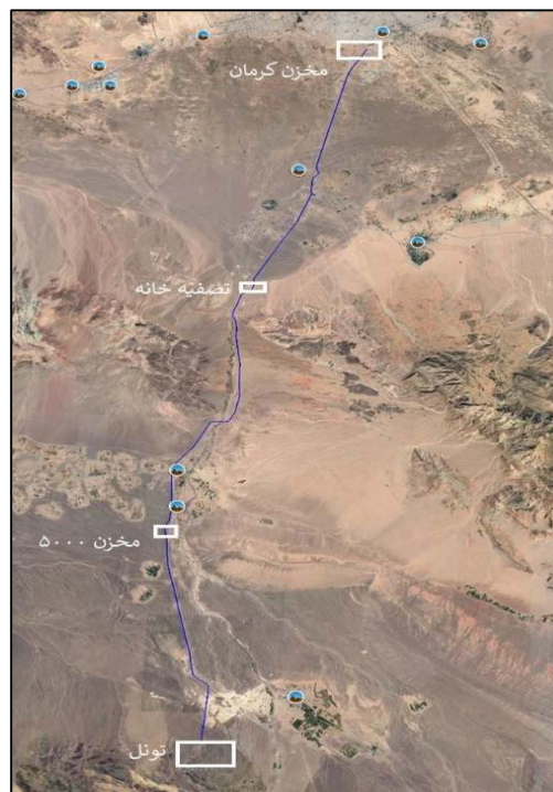
شکل (۱) پلان سامانه خط انتقال آب از سد صفارود (بخش حرکت ثقلی آب)