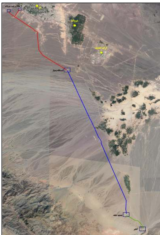
شکل (۲) پلان سامانه‌ی خط انتقال آب از سد نساء بم