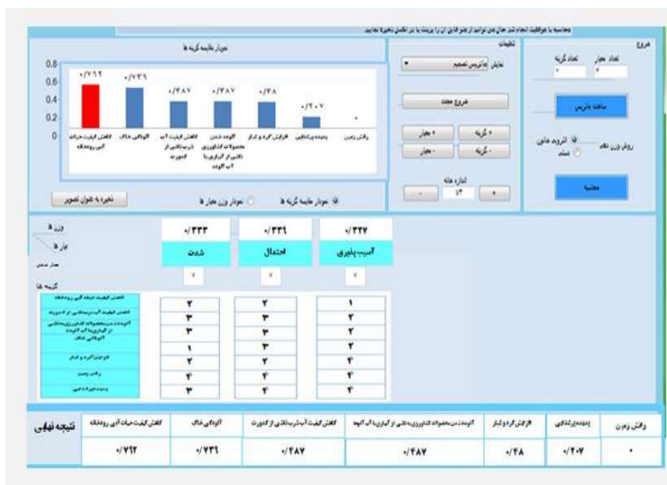
شکل (۲): ماتریس تصمیم گیری و نتایج اولویت بندی ریسک محیط فیزیکی شیمیایی فاز ساختمانی در نرم افزار Solver2014 TOPSIS