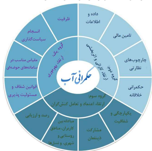
شکل (۱): اصول دوازده‌گانه OECD برای ارتقاء چرخه‌ی حکمرانی آب از خط‌مشی‌گذاری تا اجرا

در سال ۲۰۱۵، سازمان همکاری اقتصادی و توسعه (OECD) به عنوان یکی از تاثیرگذارترین نهادهای اقتصاد جهانی، مبانی مورد نیاز در حکمرانی آب را در قالب ۱۲ اصل منتشر نمود که عناوین آن در شکل (۱) ارائه شده است.