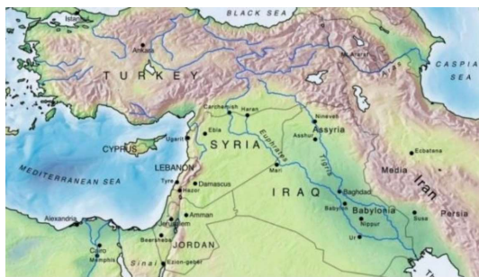
شکل (۸): کشورهای ساحلی و سدهای مهم واقع بر رودخانه‌ی دجله و رودخانه فرات (ویکی پدیا)

تاکنون رودخانه‌ی دجله و فرات موضوع مستقیم مذاکرات چندجانبه بین ایران، سوریه، ترکیه و عراق نبوده و توافقات صورت گرفته بدون حضور ایران و با تأکید بیشتر بر روی فرات بوده است.