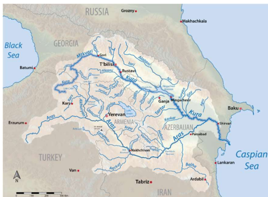
شکل (۶): حوضه آبریز، سرشاخه‌ها و مسیر جریان رودخانه‌ی کورا-ارس (ویکی پدیا)

مناطق پائین دستی این رودخانه فرامرزی محسوب می شدند (کاظم زاده، ۱۴۰۰).