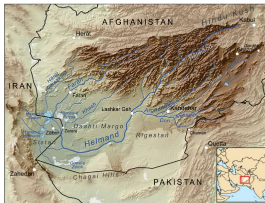
شکل (۴): حوضه آبریز، سرشاخه‌ها و مسیر جریان رودخانه هیرمند (ویکی پدیا)

در این حوضه برای توسعه کشاورزی در دشت‌های غرب و جنوب افغانستان در دست انجام دارد. همانطور که در شکل (۴)، نشان داده شده، رودخانه هیرمند از دو سرشاخه‌ی اصلی هیرمند و ارغندآب تشکیل و پس از ورود به مرز ایران به دو شاخه پریان مشترک و سیستان تقسیم می‌شود. از جمله تأسیسات اصلی رودخانه‌ی هیرمند در کشور افغانستان سد کجکی و سد ارغنداب و از تأسیسات مهم این رودخانه در کشور ایران می‌توان سه مخزن چاه نیمه، سد کهک، سد زهک و سد سیستان، که همگی بر روی رودخانه سیستان می‌باشند، را نام برد (نوبهار ۱ ، ۱۳۹۹).