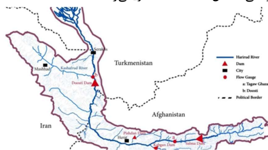
شکل (۵): حوضه‌ی آبریز، سرشاخه‌ها و مسیر جریان رودخانه هریرود (کاویانی راد، ۱۳۹۷)

افغانستان و در پائین دست سد دوستی بصورت مشترک بین ایران و ترکمنستان احداث شده است. تحت تأثیر تغییرات اقلیم چند دهه‌ی اخیر مشابه با هیرمند، حوضه‌ی هریرود نیز با کاهش بارندگی مواجه بوده است. به علاوه، رشد جمعیت و توسعه‌ی کشاورزی در نواحی بالادستی این رودخانه در کشور افغانستان، منجر به افزایش تقاضای آب و برداشت از رودخانه شده است. به لحاظ حقوقی، بین ایران و ترکمنستان برای بهره‌برداری از آب هریرود و سد دوستی، توافقنامه‌ای به امضاء رسیده است لیکن هنوز با کشور افغانستان پیرامون حقابه و رژیم بهره‌برداری از هریرود توافقی حاصل نشده است (کاویانی‌راد ۱ ، ۱۳۹۷).