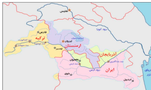
شکل (۷): کشورهای ساحلی و سدهای مهم واقع بر رودخانه ارس (کاظم‌زاده، ۱۴۰۰)

۴- با توجه به اینکه رودخانه‌ی ارس قسمتی از مرز رسمی کشورهای ساحلی خود را تشکیل می‌دهد، تغییر مسیر رودخانه و در نتیجه تغییر مرز رسمی کشور یکی دیگر از چالش‌های مربوط به این آبراهه می‌باشد.